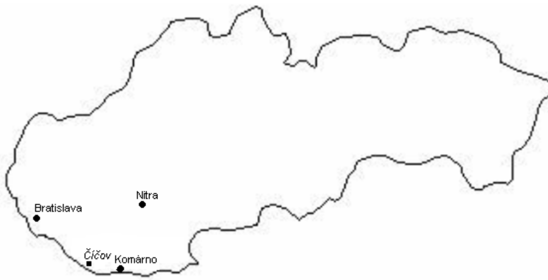
Mapa 1: Poloha obce Čičov na Slovensku vo vzťahu k hlavnému mestu, krajskému centru a obvodnému/okresnému mestu