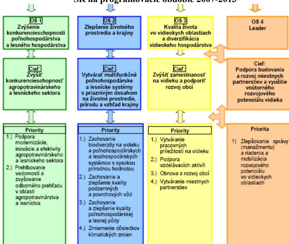
Graf 3: Prehľad osí, cieľov a priorit Národného strategického plánu rozvoja vidieka SR na programovacie obdobie 2007-2013

Prameň: Národný strategický plán rozvoja vidieka SR na programovacie obdobie 2007-2013